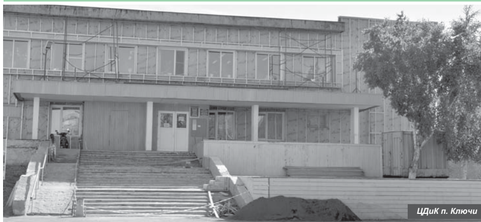
ЦДиК п. Ключи

На завершающей стадии находятся мероприятия по капитальному ремонту Центра досуга и культуры Ключевского сельского поселения.