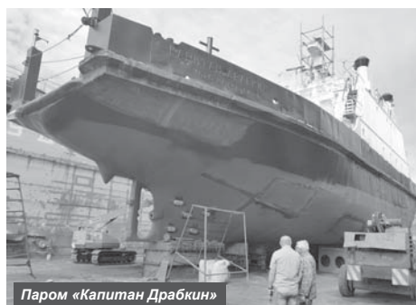
Паром «Капитан Драбкин»

Плановый ремонт парома «Капитан Драбкин» будет завершён в сентябре