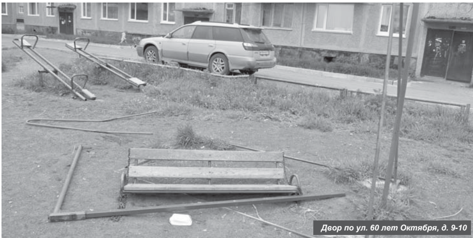
Двор по ул. 60 лет Октября, д. 9-10

В очередной раз после действий неизвестных в м. Погодном в районном центре были сломаны сразу несколько игровых элементов на детских площадках.